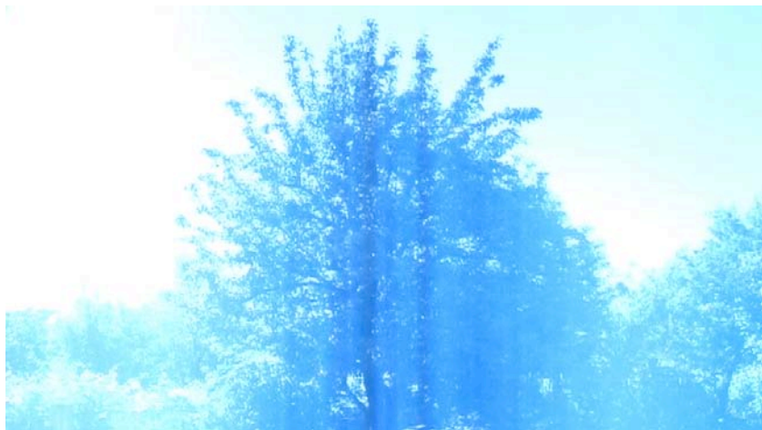
Alberte Pagán. Eclipse , 2010. 20'