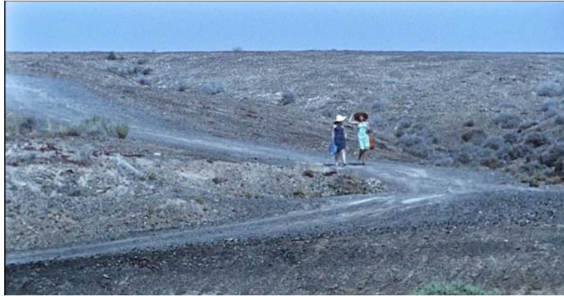
Samuel Alarcón. La caja de Medea , 2013. 17'