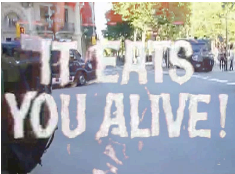
Kikol Grau. Empresarios y secretas , 2013. 05' 20"