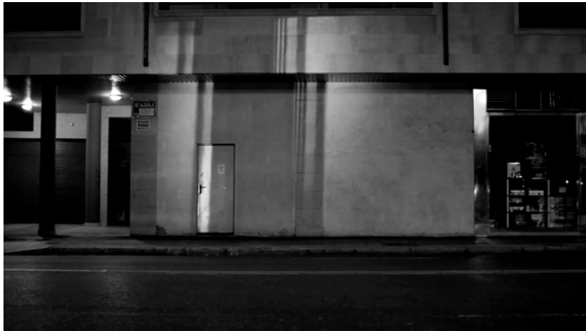
Chus Domínguez. Kubrick , 2012. 14'