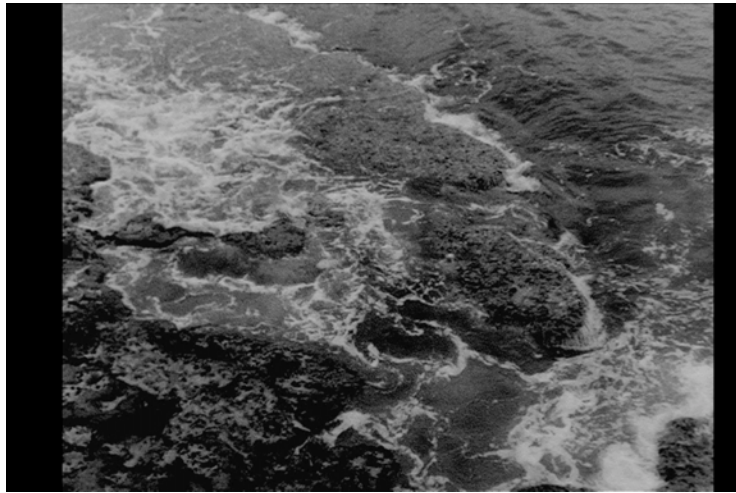
Verónica Ibarra. Anatidae , 2012. 4'