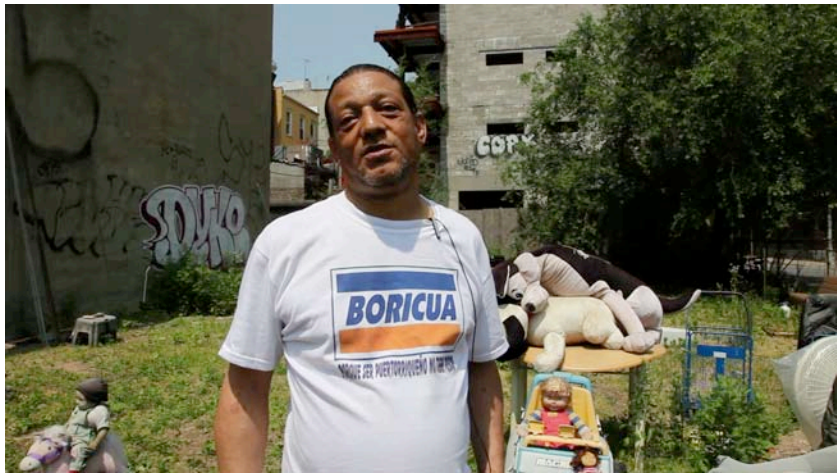
Guillermo G. Peydró. Louie's toy garden , 2011. 12'